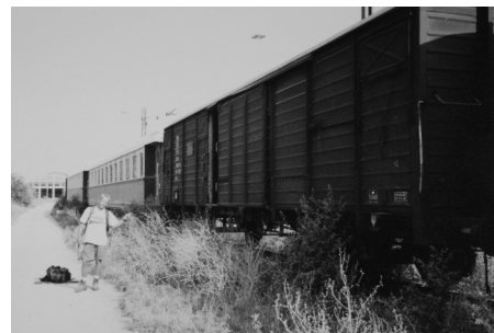
Ons vijfsterrenhotel, waarvan wij dachten dat hij al wfu was...

We schrijven augustus 2001 toen we vroeg in de avond in Thessaloniki arriveerden. Ook deze avond was het weer de vraag waar we die nacht zouden gaan slapen. Na enige tijd brainstormen kwam er een oude oplossing in ons op: juist ja, de oude treinwagon.