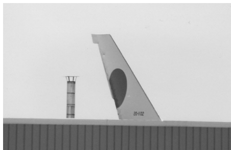
Waar staat die Japanse 747 nu ergens...? (Luxemburg-Findel, 1997, Eric Schel)

En ja, hier troffen we de twee keizerlijke 747's aan, toch nog iets van een buit na zo'n 1100 kilometer karren.